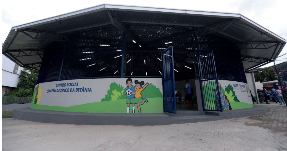
A obra recebeu investimento de aproximadamente R$ 1,7 milhão e integra um conjunto de ações do Governo do Amazonas

A aposentada Darcy Nunes, de 84 anos, moradora do bairro há mais de 60 anos, se emocionou ao visitar o espaço após a reforma, especialmente ao ver sua imagem grafada nas paredes do Chapéu de Zinco, em uma homenagem à sua trajetória na comunidade.